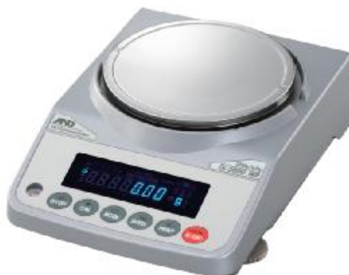
Рисунок 1 – Общий вид весов

Общий вид весов представлен на рисунке 1.