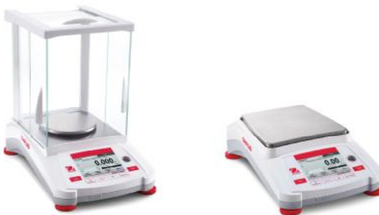
Рис. 1 Общий вид весов Adventurer

Принцип действия весов основан на компенсации массы взвешиваемого груза электромагнитной силой, создаваемой системой автоматического уравновешивания. Электрический сигнал, изменяющийся пропорционально массе взвешиваемого груза, преобразуется в цифровой сигнал. Результаты взвешивания выводятся на ЖК дисплей.