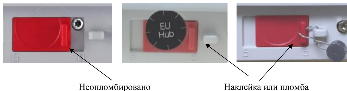
Рис. 3 Схема пломбировки от несанкционированного доступа

Схема пломбировки весов от несанкционированного доступа приведена на рис. 3.