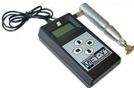
Рисунок 1 – Внешний вид твердомера МЕТ-У1

Внешний вид твердомера МЕТ-У1 приведён на рисунке 1, схема пломбировки от несанкционированного доступа на рисунке 2.