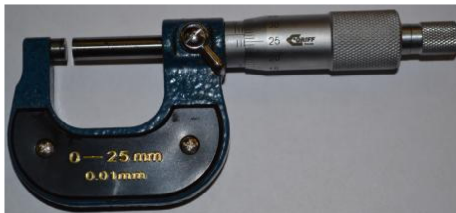
Рисунок 1 - Общий вид микрометров торговой марки «GRIFF» с отсчетом по шкалам стебля и барабана

Измерительные поверхности оснащены твердым сплавом. Для установки микрометров с нижним пределом измерений от 25 мм в начальное положение используется установочная мера. Микрометры комплектуются одной установочной мерой. Скобы микрометров оснащены термоизоляционными накладками для предотвращения влияния тепла рук.