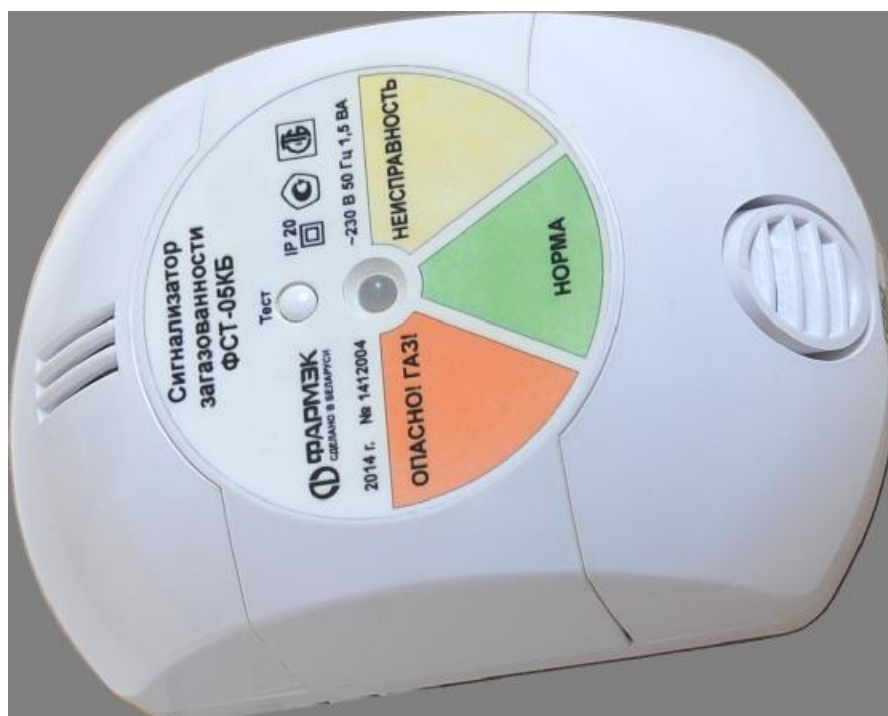
Рисунок 1 - Внешний вид сигнализатора загазованности ФСТ-05КБ