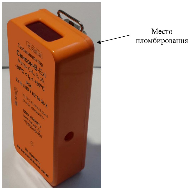
Рисунок 1 - Общий вид исполнения В (индивидуального)