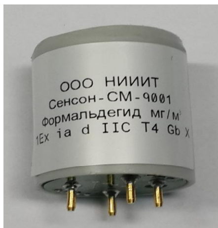
Рисунок 7 - Общий вид исполнения СМ (измерительный интеллектуальный модуль)

Пломбирование исполнения СМ не предусмотрено.