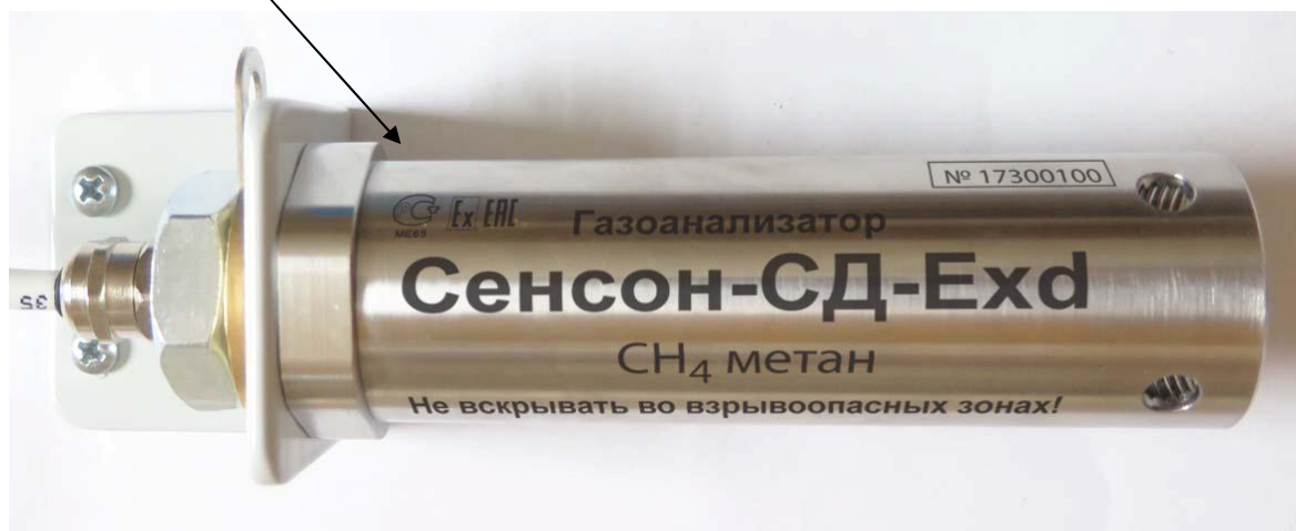
Рисунок 6 - Общий вид исполнения СД (в металлическом взрывозащищенном корпусе Exd)