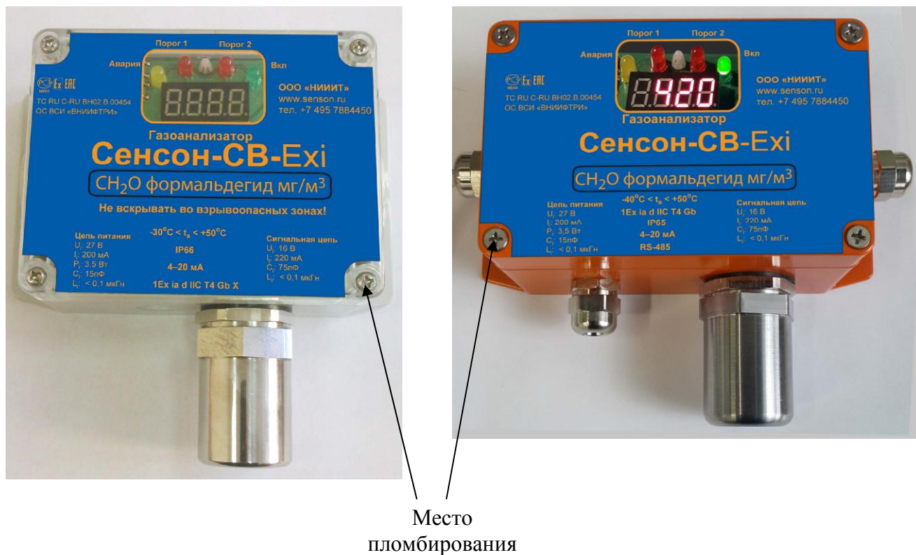
Рисунок 3 - Общий вид исполнения СВ (в пластмассовом или металлическом корпусах)